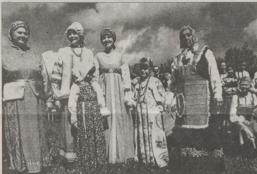
В конкурсе побеждают Аринушки.

(Подробнее о празднике читайте на 3-й стр.)